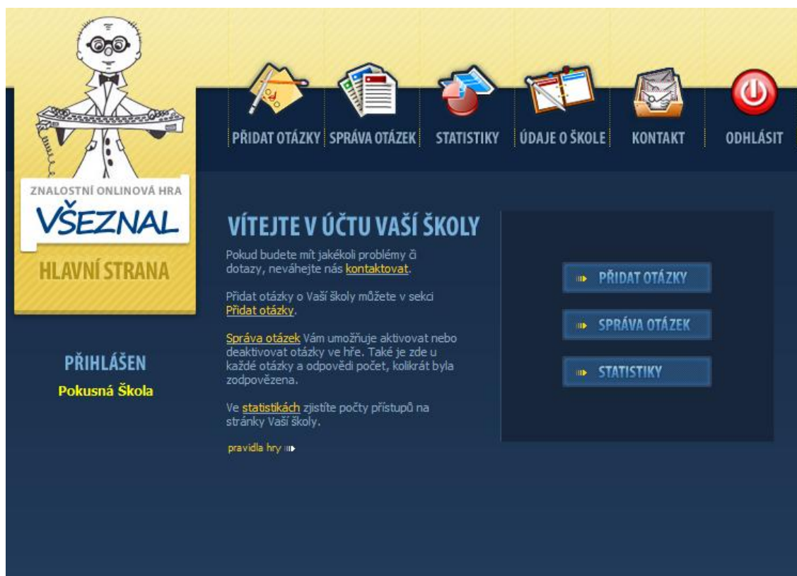
Obr. 3 – Úvodní strana účtu

Úvodní obrazovka (obr. 3) účtu Vaší školy se zobrazí po přihlášení. Z této stránky se pomocí odkazů dostanete ke všem funkcím aplikace.