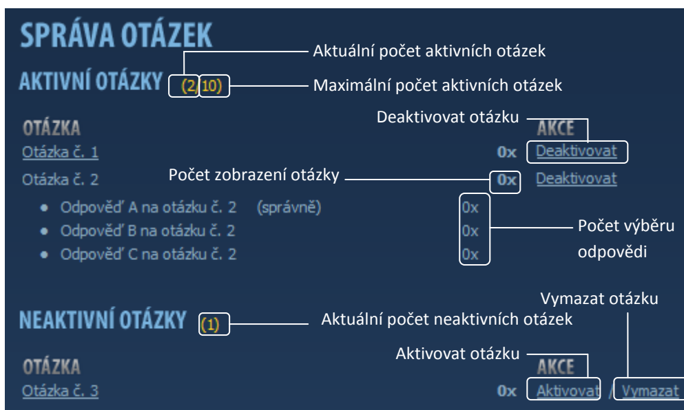
Obr. 5 – Správa otázek

Funkci Správa otázek naleznete po přihlášení na adrese http://www.vsezna.cz/sprava-otazek/ .