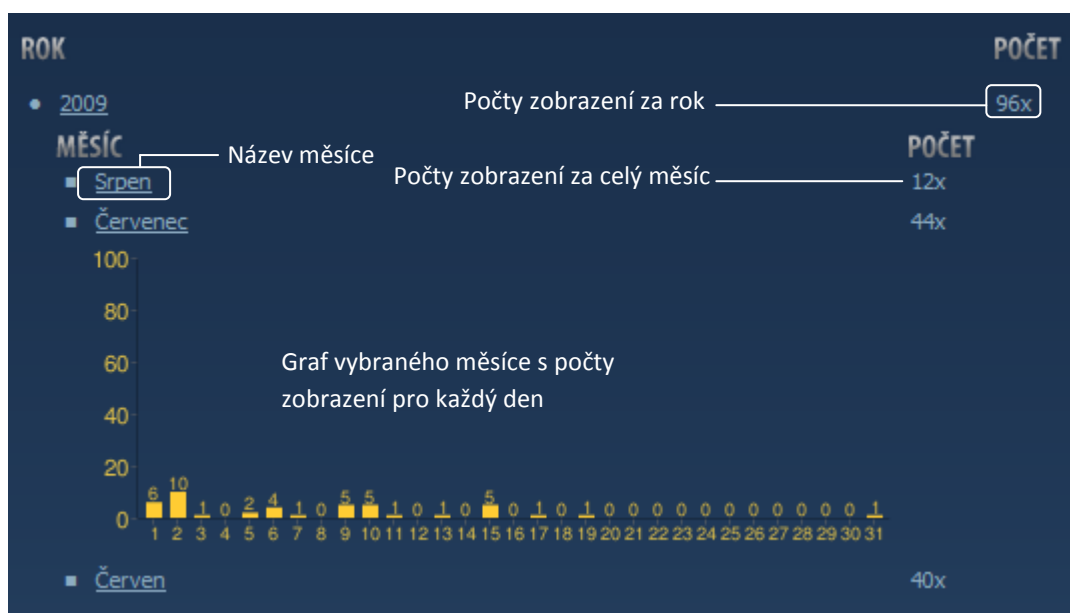
Obr. 6 – Statistiky

Funkci Statistiky naleznete po přihlášení na adrese http://www.vsezna.cz/statistiky/ .